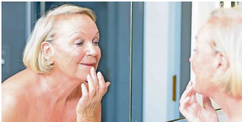
Best-Aging fängt bereits mit 20 Jahren an.