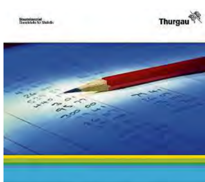
Deutlich höhere Auszahlungen beim Finanzausgleich Finanzausgleich Politische Gemeinden 2023 Auf www.statistik.tg.ch ist die Statistische Mitteilung abrufbar.

Kanton Thurgau Im Rahmen des Finanzausgleichs zwischen Kanton und Politischen Gemeinden wurden im Jahr 2023 insgesamt 20.8 Millionen Franken an 40 Gemeinden ausbezahlt. Dies ist deutlich mehr als im Vorjahr (+1.3 Mio. CHF oder +6,9 Prozent). Sowohl die Anhebung finanzschwacher Gemeinden