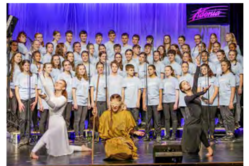
Einer der Chöre der christlichen Jugendorganisation Adonia, die Musicalcamps, Konzerttourneen und Sportcamps durchführt.

Über 1200 singbegeisterte Teenager beteiligen sich im Frühling 2024 in der ganzen Schweiz am diesjährigen Musical-Grossprojekt «Zachäus» der christlichen Jugendorganisation Adonia. Insgesamt gastieren sie in über 80 Ortschaften in der Deutschschweiz und der Romandie. Einer dieser Chöre tritt heute Freitag, 5. April, um 20 Uhr im Gemeindesaal Steinach auf. Der Eintritt ist frei, es wird eine freiwillige Kollekte erhoben. pd