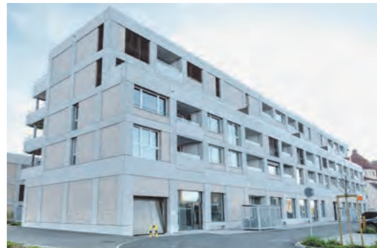
Im Juli soll die «Kleintierklinik am See» in Horn eröffnen. lg

Nach der erteilten Baubewilligung ist es nun definitiv: Die «Kleintierklinik am See» öffnet Mitte Juli ihre Praxistüren in Horn. Die Seegemeinde gewinnt dabei nicht nur eine Tierärztin, sondern auch einen Hundecoiffeur-Salon.