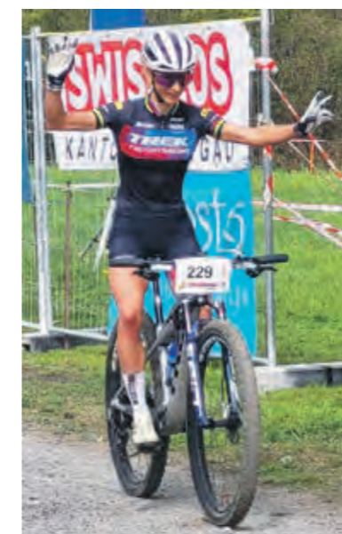
Olympiasiegerin Jolanda Neff bei der Zieleinfahrt in Arbon.