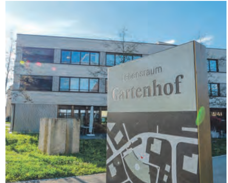
Der «Gartenhof» soll kein Fass ohne Boden werden.