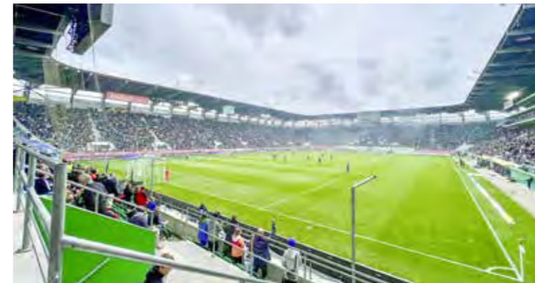
Der Kybunpark ist die Heimstätte des FC St. Gallens. Der Name des Stadions gibt diese Woche zu reden.