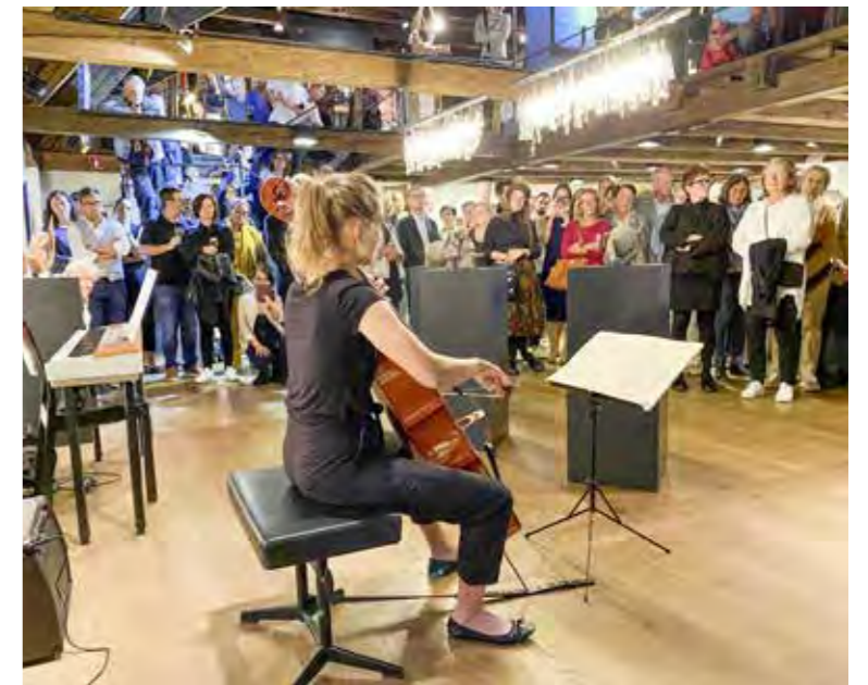
Das letzte «Arbon Artist» war ein voller Erfolg. Nun kommt es in einer zweiten Ausgabe zurück ins Schloss Arbon.

Ein besonderer Höhepunkt der Ausstellung stellen die Werke des ehemaligen Appenzeller Malers und Grafikers Axel Kuhle dar, welche von Guido Rupp zur Verfügung gestellt werden. Kuhle hat bereits 1978 im Schloss Arbon ausgestellt. Eingeläutet wird die «Arbon Artist Edition 2» mit der Vernissage am Freitag, 5. April, um 19 Uhr mit Musik, Tanz