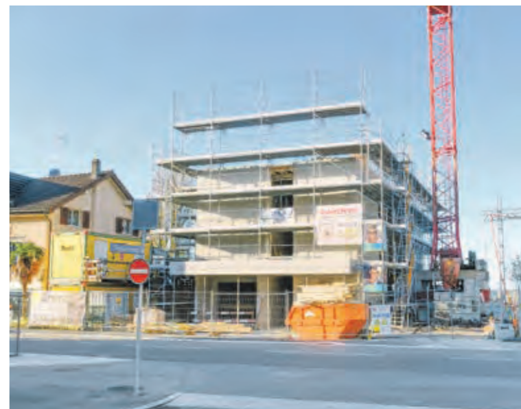
Die Arbeiten am Neubau des Restaurants Lido in Horn dauern an. lg

Vor eineinhalb Jahren kündigte das Restaurant Lido in Horn eine vorübergehende Schliessung wegen Abbruch und Neubau an. Aus der angestrebten Wiedereröffnung ein Jahr später wurde nichts. Erst im Frühling 2025 soll es soweit sein.